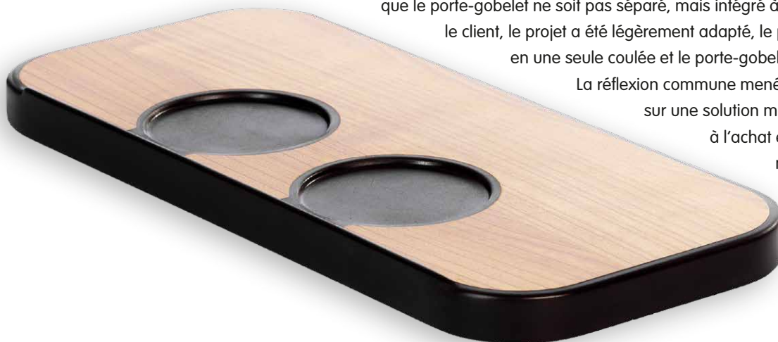
Table résistante aux chocs avec porte-gobelets dans le train Pendolino

La réflexion commune menée avec le client a débouché sur une solution moins onéreuse, avantageuse à l'achat et à l'usage, et plus facile à nettoyer. Par ailleurs, l'élégant raccord du porte-gobelet à la surface de la tablette a permis d'obtenir un magnifique résultat esthétique.